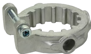
TQT2CSPT adapter ring