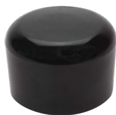
TQT2C butée pour poignée