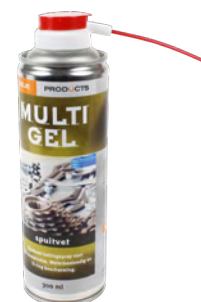
1063HQ spray de graisse de qualité